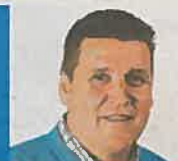
Henk Verhofstadt Open voor de Mens